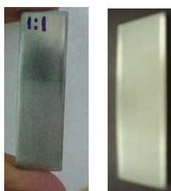
Figura 2 – comparativo entre as amostras antes e depois da imersão na suspensão de \text{HNO}_3 . Amostra recoberta à esquerda e sem recobrimento à direita

As variáveis pH e campo elétrico favoreceram a deposição do filme de \text{TiO}_2 sobre o substrato (figura 2) na suspensão que utilizou como solvente \text{HNO}_3 (pH da ordem de 0,5), em função da força eletrostática sobre o \text{TiO}_2 que neste pH adquire carga positiva na superfície e pode ser atraído facilmente pelo campo elétrico gerado ao redor do substrato, avaliação qualitativa pelo teste da fita indicou uma adesão satisfatória do recobrimento sobre o substrato, com o tempo da ordem de 2 a 4 min.