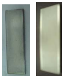
Figura 4 – comparativo entre as amostras antes e depois da imersão na suspensão de NaOH . Amostra recoberta à esquerda e sem recobrimento à direita

No caso da suspensão com NaOH 4% uma fina camada foi depositada, mas não apresentou qualquer aderência sobre o substrato (figura 4), possivelmente devido ao efeito da camada passivadora ( \text{Cr}_x\text{O}_y , não corrompida) do substrato associado as tensões residuais impedindo a interação entre a superfície do substrato e o filme depositado o que provocou uma adesão não satisfatória.